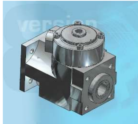
Modello 3D in formato CAD nativo del cliente - componente di marca "B"

Dia ai suoi clienti i modelli CAD 3D (e 2D) dei vs componenti nel formato CAD che loro desiderano , sarà un motivo "in più" per far preferire il suo prodotto. "Fatevi" il catalogo elettronico con CADENAS; queste aziende si sono già attrezzate: